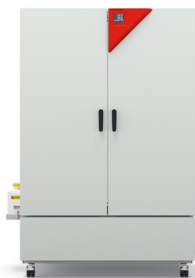
Model KBF-S ECO 1020