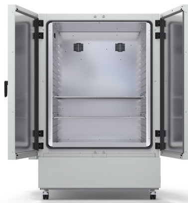
Model KBF-S ECO 1020