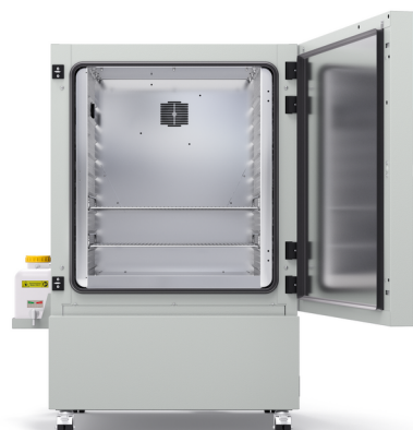
Model KBF-S ECO 240