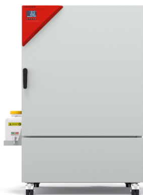
Model KBF-S ECO 240