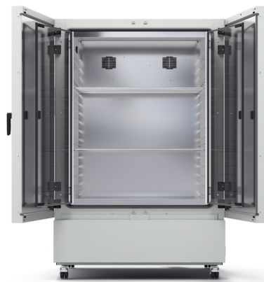
Model KB ECO 720