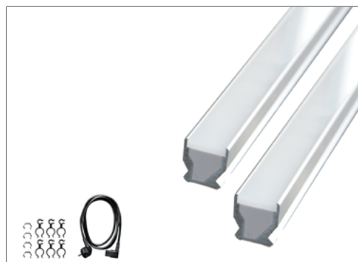
Zakres dostawy zestawu do rozbudowy