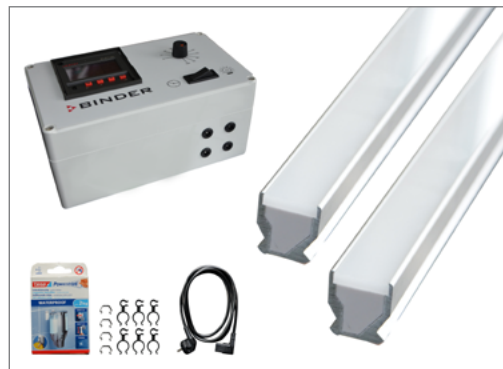
Zakres dostawy zestawu podstawowego