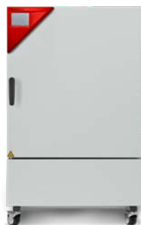
› Model KBF 240