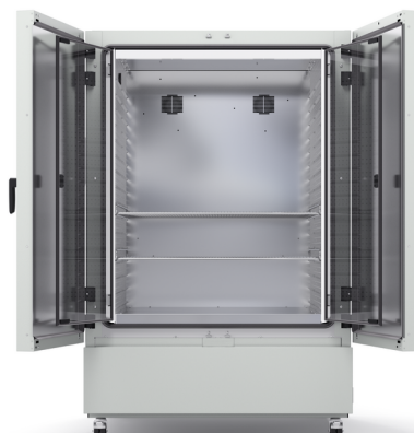
Modelo KB ECO 1020