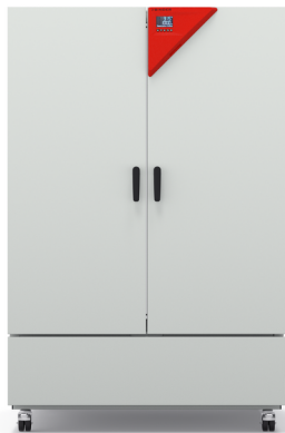
Modelo KB ECO 1020