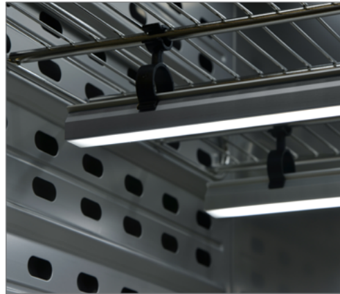
Rampe lumineuse de 50 cm, fixée avec des clips en plastique à la clayette-grille