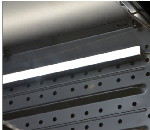
Rampe lumineuse de 30 cm, fixée avec tesa Powerstips® à la paroi latérale de l'enceinte