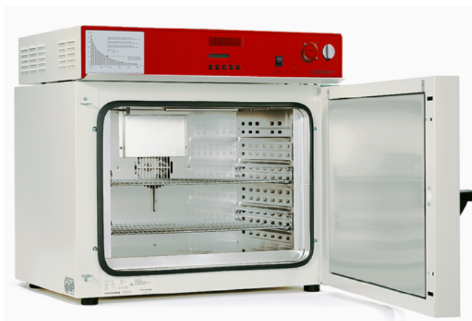
Modèle FDL 115