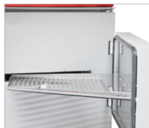
Passage pour coil coating