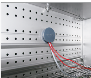
Port d'accès équipé d'un obturateur en silicone

► Tous les extras en ligne go2binder.com/fr-options