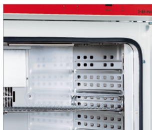
Joint de porte