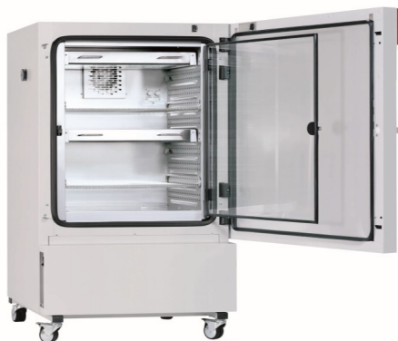
▲ Chambre climatique avec illumination KBW