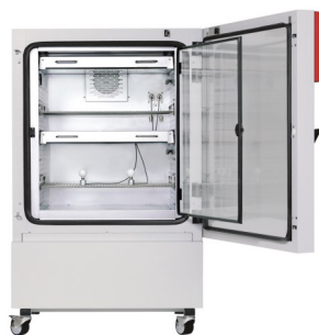
▲ Konstantklimaschrank KBF LQC