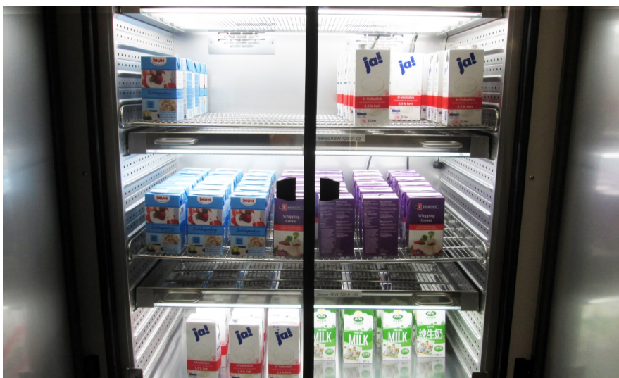
▲ Haltbare und frische Milch- und Molkereiprodukte im Test