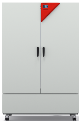
Modèle KB ECO 720