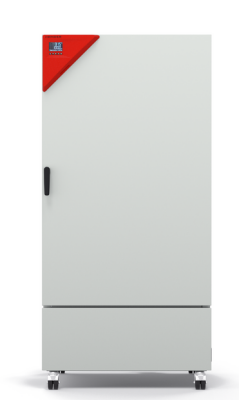
Modèle KB ECO 400