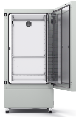
Modell KB ECO 400