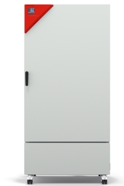
Modell KB-ECO 400