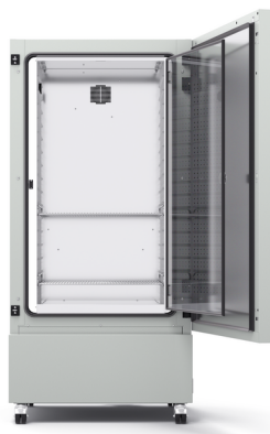
Modell KB ECO 400