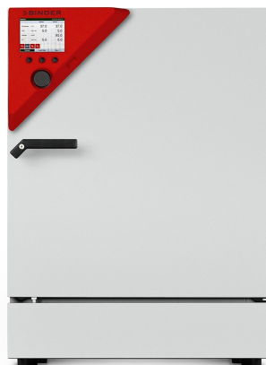
▲ CO 2 -Inkubator CB 160